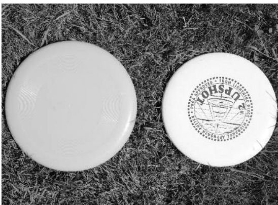
E gwönleche und e disc golf frisbee.

Dä artikel richtet sich nach de zürütütsche rächt-schriibig nach Schobinger, www.zuerituetsch.ch/schreiben.html