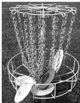
En volle fängerchorb.